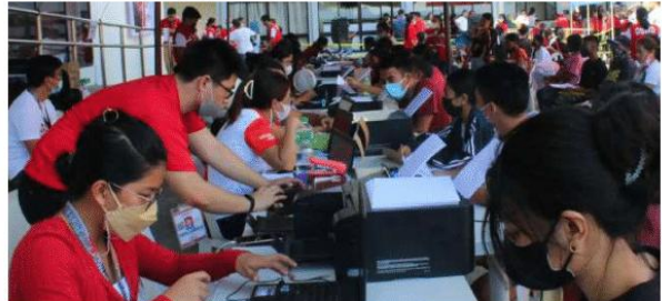
Nagsimula nang gawin ng Department of Social Welfare and Development (DSWD) na i-digitize ang kanilang mga system at programa bilang paghahanda para sa 2026, kabilang na ang Automated Crisis Intervention Management System.

ay ang paggamit ng e-wallets para sa distribusyon ng tulong pinansyal, kung saan hindi kailangan ang physical payout sites, na kadalasang nagiging sanhi ng mahabang pila at impluwensya sa politika. Bukod dito magsasagawadin ang DSWD ng online interviews para sa mga hihingi ng tulong, na papalit sa mga physical assessments. Nabatid na ang hakbang ay upang maging mabilis at accessible ang proseso para sa mga mamamayan.