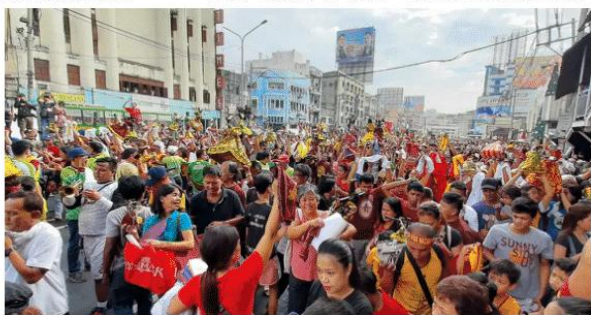
Muling magsasagawa ng 'Thanksgiving Procession' ang Minor Basilica and National Shrine of Jesus Nazareno o kilala bilang simbahan ng Quiapo bago matapos ang taong kasalukuyan.

Ang nabanggit na Thanksgiving Procession ang siyang hudyat sa pagsisimula ng selebrasyon sa simbahan ng Quiapo sa gaganaping Traslacion o Nazareno 2025.