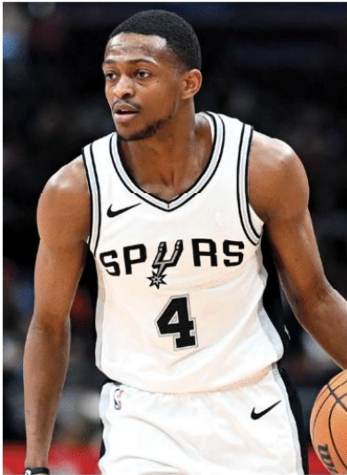
Tinalo ng San Antonio Spurs ang koponan Oklahoma City Thunder na dating kampeon at may hawak ng pinakamagandang record ngayon sa NBA sa iskor na 117-102.