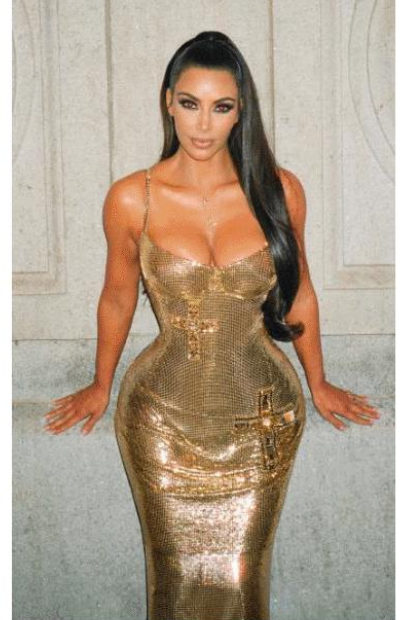
Kim Kardashian found herself at the center of an animal welfare discussion after sharing that she gifted her four children Pomeranian puppies for this year's Christmas, a move that was quickly called out by People for the Ethical Treatment of Animals (PETA).

As of writing, both Kim and Khloé have yet to release a statement addressing PETA's comments or the concerns raised online.