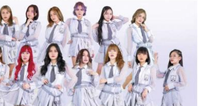
MNL48 is set to begin a new chapter as the group officially announced plans to change both its operating company name and group name in January 2026. The announcement was shared through an official statement on X (formerly Twitter), marking a significant shift for the pioneering Filipino idol group as it continues to evolve with the changing P-pop landscape.

The group's return to the stage included major milestones such as the MNL48: Reboot and Rise mini-festival in April and the Dream Beyond Concert held last October 11, where fifth-generation members were introduced and leadership updates were announced. These events highlighted MNL48's ongoing efforts to rebuild and move forward. MNL48 was formed in 2018 through the efforts of becoming the first idol group of its kind in the Philippines. The sing-and-dance group was created through a four-month talent search aired on It's Showtime, introducing a new idol culture to the local entertainment scene. It is a sister group of Japan's AKB48, whose influence has led to the creation of similar groups across Asia.