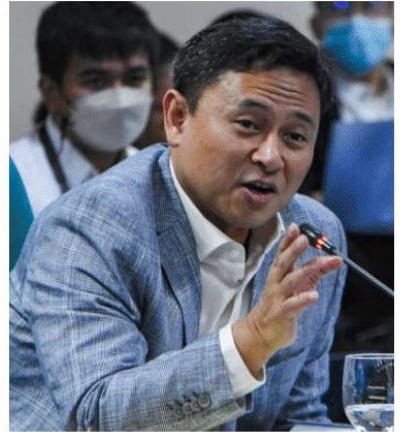
Pinangunahan ni Department of Education (DepEd) Secretary Sonny Angara ang DepEd Heroes Awards nitong Biyernes, Disyembre 26, kung saan kinilala ang iba't ibang indibidwal, pitong guro, anim na mag-aaral, at tatlong pribadong mamamayan.

Ayon sa ulat, ilan sa mga pinarangalan ay bumabyahe ng ilang oras sa maputik o bahaing lugar upang makapaguro. Ang iba naman ay patuloy na nagtuturo kahit sumasailim sa chemotherapy, at mayroon ding sumusuong sa lindol at bagyo upang matiyak na hindi maaantala ang pag-aaral ng mga estudyante.