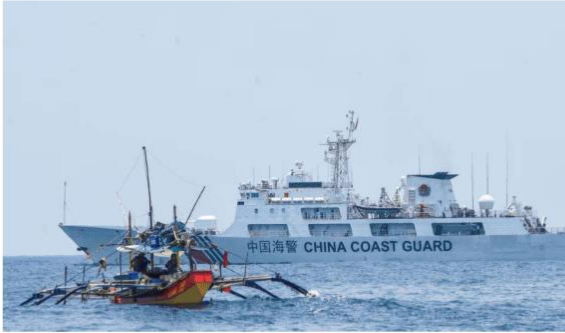
Muling nanindigan ang Armed Forces of the Philippines (AFP) na ipagpapatrolyo nila ang kanilang mga nasimulang pagpapatrolyo sa West Philippine Sea sa kabila yan ng mga kritisismo mula sa panig ng China.