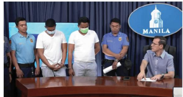
Simulan na ng Intramuros Administration (IA) ang pag-proseso para i-terminate ang kontrata ng JSL Security Agency, ang kompanyang may ahawak sa dalawang security guards na viral habang binubugbog ang isang 17-anyos na batang lalaki sa Pasig River Esplanade sa Intramuros, Manila, noong Linggo ng gabí, Pebrero 8.

Maharap naman ang dalawang security guard sa mga kasong physical abuse sa ilalim ng R.A. 7610 o Special Protection of Children Against Abuse, Exploitation and Discrimination Act.