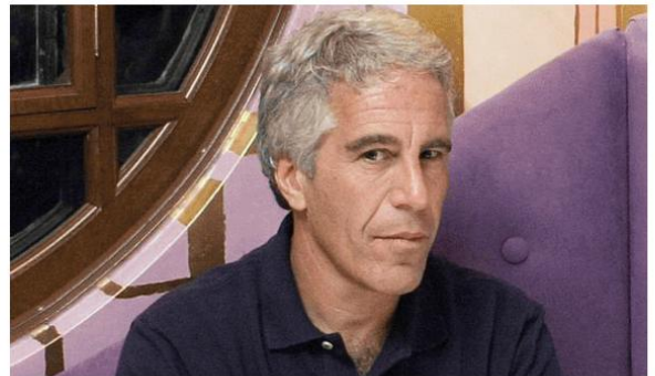
Lumabas sa mga dokumentong inilabas ng United States Department of Justice (DOJ) na umanong nag-hire ang yumaong sex offender na si Jeffrey Epstein ng isang team na naka-base sa Pilipinas upang burahin at takpan ang mga negatibong impormasyon tungkol sa kanya sa internet.

Magugunitang si Jeffrey Epstein ay inaresto noong 2019 sa kasong sex trafficking at pang-aabuso sa mga menor de edad sa US at iba pang bansa. Siya ay namatay habang nakakulong sa New York jail noong parehong taon habang hinahintay ang kanyang paglilitis.