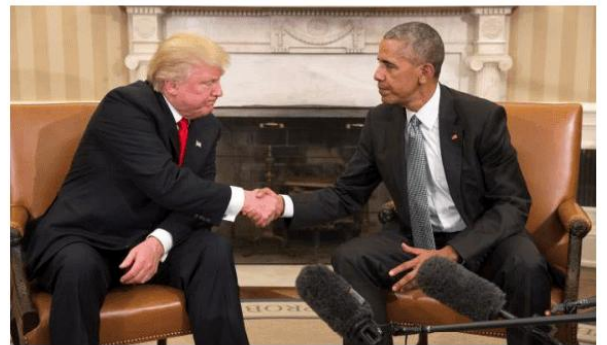
Tila hindi na kinagulat ni dating U.S. President Barack Obama ang umano'y kawalan ng hiya at decorum sa political discourse sa Amerika matapos lumabas ang isang kontrobersyal na video sa social media account ni U.S. President Donald Trump.

Bukod sa isyu ng ocial media post, tinuligsa rin ni Obama ang immigration crackdown na isinagawa ng administrasyon ni Trump sa