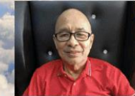
by: Bro. Ernie Acayan