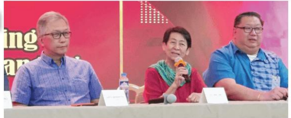
MANILA, Philippines — The Association for Philippines-China Understanding (APCU) has officially opened nominations for the 6th Award for Promoting Philippines-China Understanding (APPCU) 2026 during a launch held Friday at the Federation of Filipino Chinese Chambers of Commerce and Industry, Inc. (FFCCCI) in Binondo, Manila.