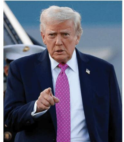
Inihayag ni US President Donald Trump na malapit ng matapos ang digmaan sa Iran, subalit hindi pa ito ngayong linggo.

Itinalaga ng Iran si Mojtaba Khamenei bilang kanilang bagong supreme leader. Siya ang anak ng napaslang na si Ayatollah Ali Khamenei. Pinili siya ng Assembly of Experts ng Iran na binubuo ng 88-member body ng elected senior cleric na ang trabaho ay pumili ng supreme leader. Huling pumili ang assembly noong itinatag ang Islamic Republic noong 1979. Napili noon si Ali Khamenei matapos ang pagpanaw ni Ayatollah Ruhollah Khomeini ng mahigit tatlong dekada. Una ng sinabi ni US President Donald Trump na hindi rin magtatagal ang mapipiling bagong supreme leader ng Iran. Magugunitang nasawi si