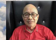
by: Bro. Ernie Acayan