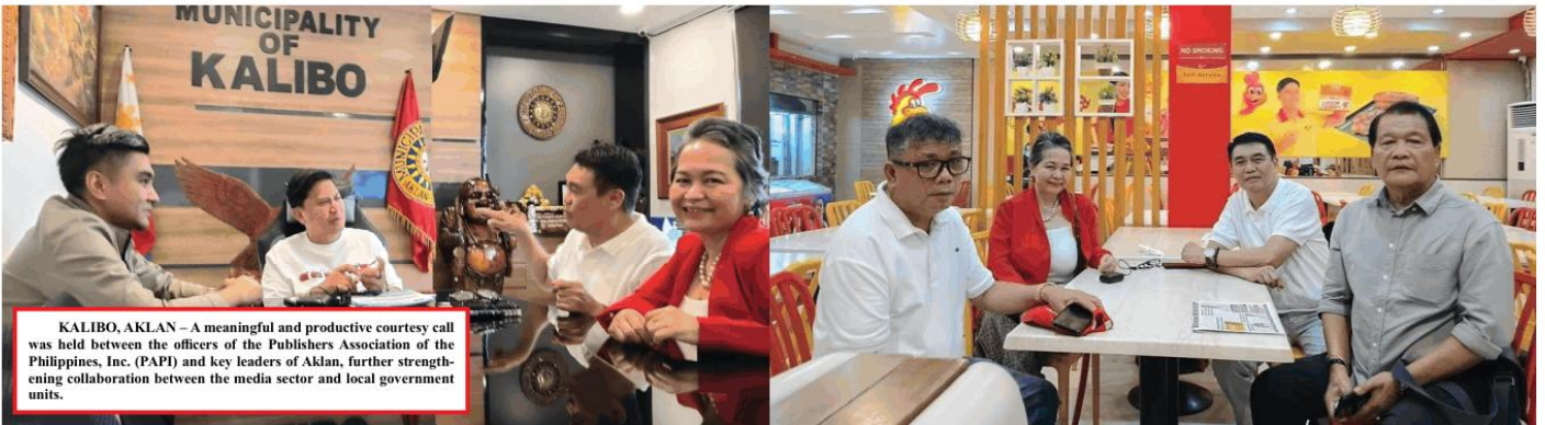
KALIBO, AKLAN – A meaningful and productive courtesy call was held between the officers of the Publishers Association of the Philippines, Inc. (PAPI) and key leaders of Aklan, further strengthening collaboration between the media sector and local government units.