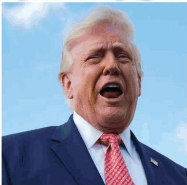
Sinabi ni U.S. President Donald Trump nitong Sabado (araw sa Amerika) na may 48-oras lamang ang Tehran upang makipagkasundo o haharapin nito ang "all hell," habang ang tropa ng Estados Unidos at Iranian ay nagsasagawa na nang paghahanap para sa isang napabagsak na U.S. airman.

"Remember when I gave Iran ten days to MAKE A DEAL or OPEN UP THE HORMUZ STRAIT. Time is running out - 48 hours before all hell will reign down on them," ani Trump sa kanyang post sa Truth Social.