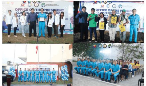
For a New Philippines, the newly appointed members of the Climate Change Task Force – Science and Technology for Environmental Progress (CCTF-STEP) took their oath to fulfill their vital role in protecting the environment through science and technology.

May this serve as an inspiration for everyone to continue fulfilling our responsibilities with integrity, dedication, and genuine concern for the environment and the nation.