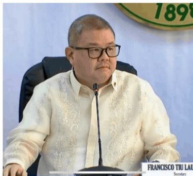
Personal na tinungo at nakipagugnayan ang Department of Agriculture (DA) sa mga lokal na magsasaka sa