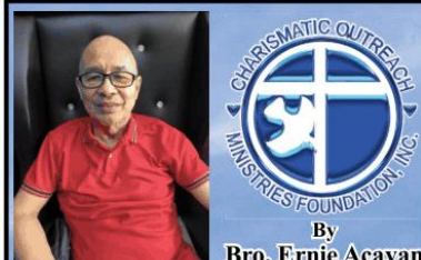
By Bro. Ernie Acayan

Publication: PVN Point Viewer Publishing Dates: March 30, April 06 & 13, 2026