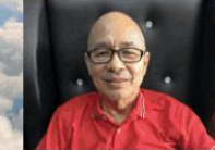
by: Bro. Ernie Acayan