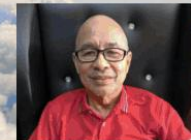
by: Bro. Ernie Acayan