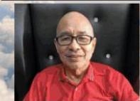
by: Bro. Ernie Acayan